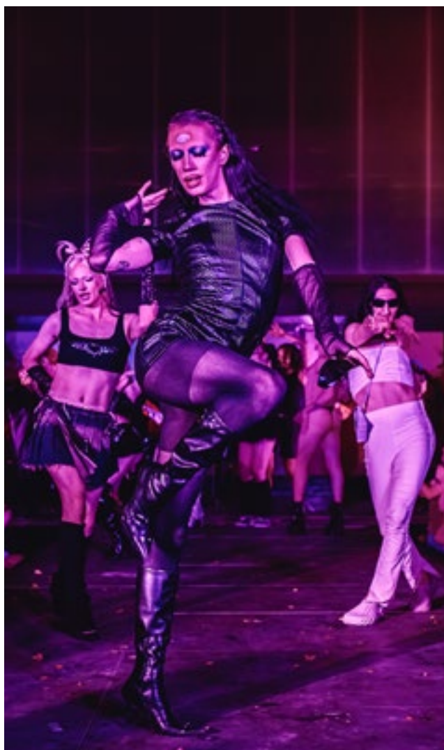
Festival Intérieur Queer, Arty Farty, Lyon