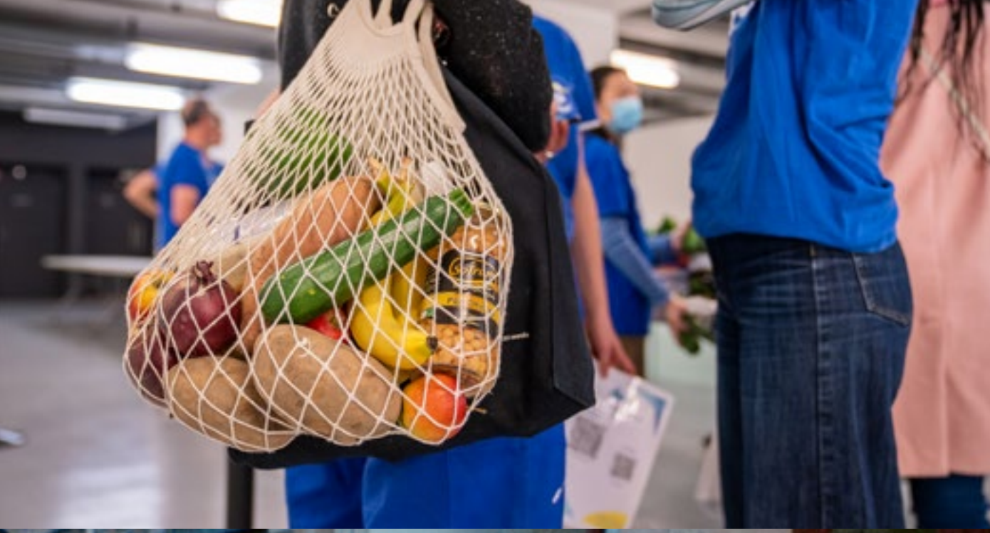
Humanity Diaspo