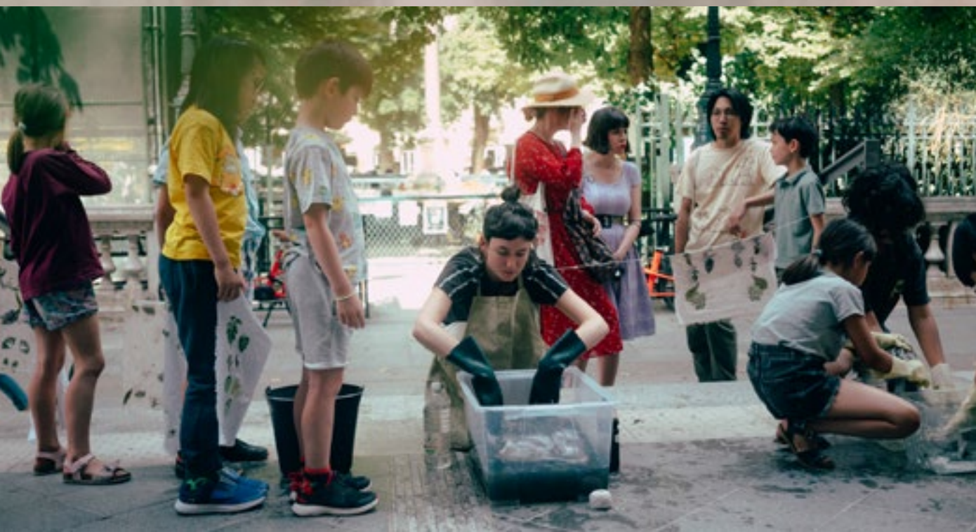
Eci on imagine l'expo Février-juin 2024

Le musée de la migration de la Cité de la Musique, en collaboration avec l'association Singa, organise une exposition interactive et immersive sur la migration humaine.