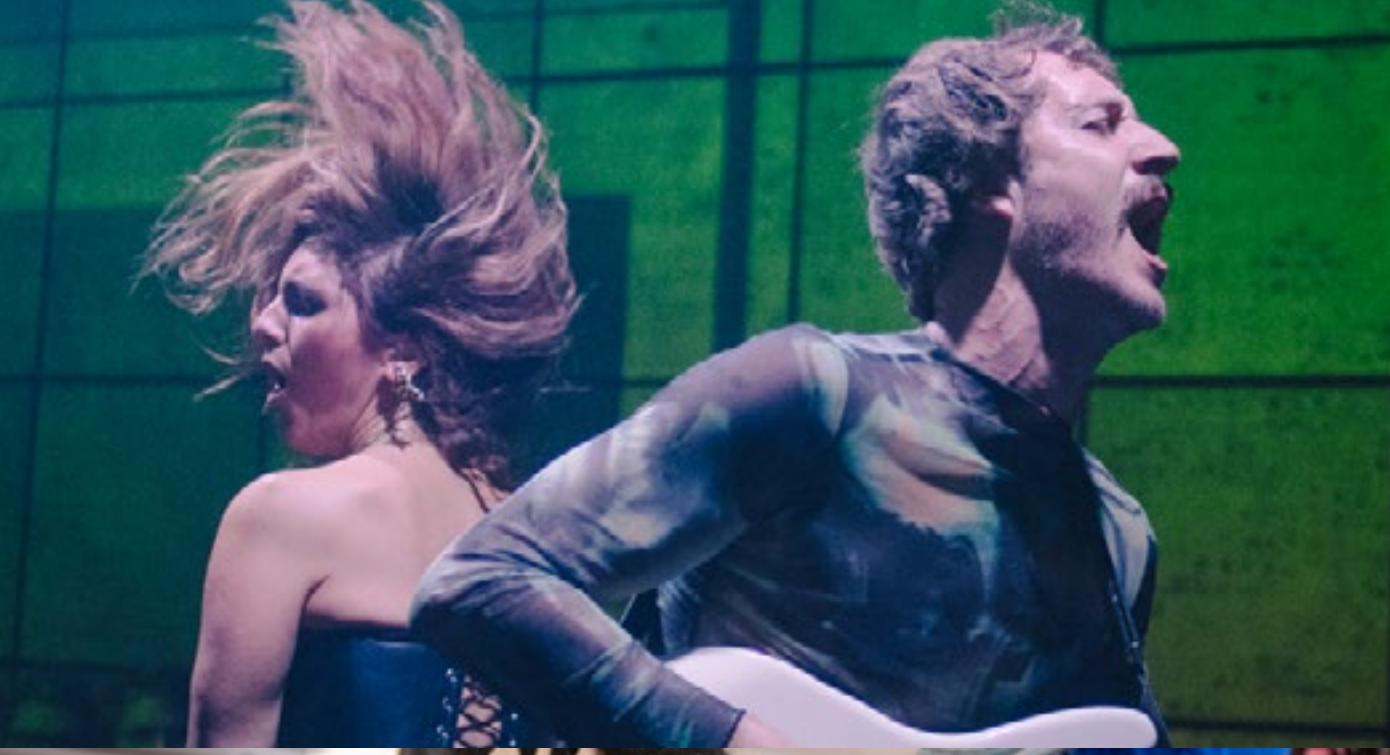
ARTE Concert Festival